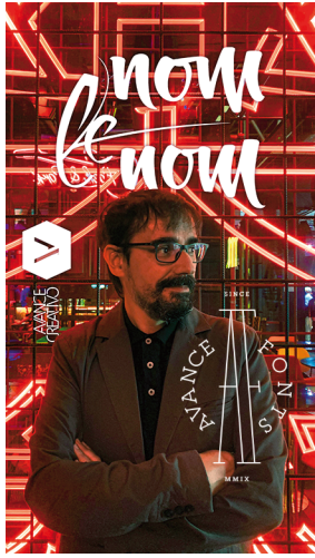
Última actualización del CV: ENE 2023.